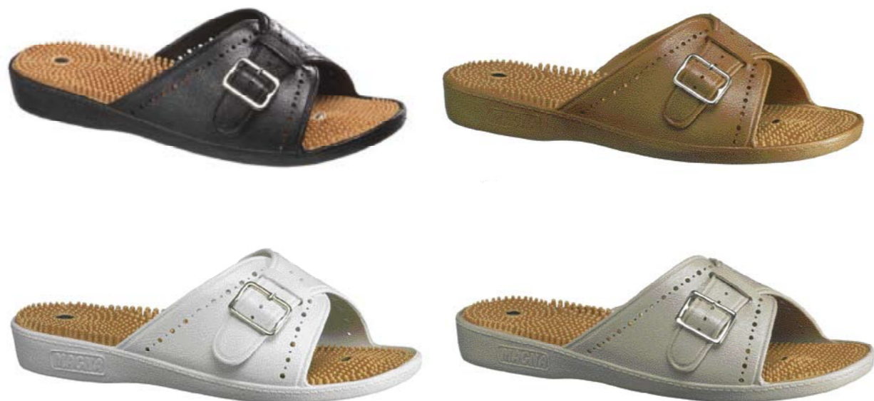
1. Nabbsandal. Art. 711000