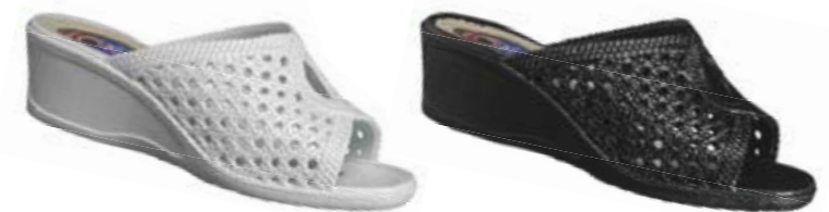
4. Kilklackssandal. Art. 605000