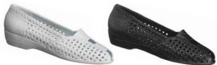
3. Cherry. Art. 680000