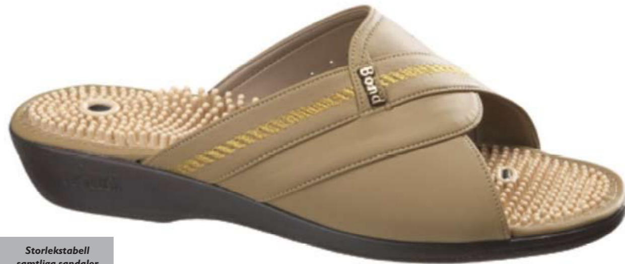
1. Bond. Art. 416000

04 Kilklackssandal. Art. 605000. 5 cm kilklack. Ger ett skönt stöd åt hålfoten. Storlekar: 34/35-40/41. 2 färger: Svart, Vit.