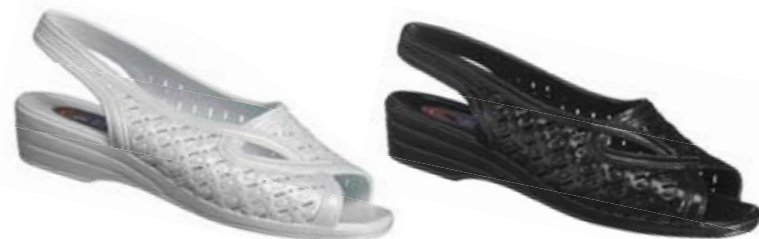
2. Bakremssandal. Art. 800000